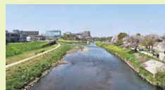
富士下橋からの眺望。新河岸川が分岐した先に鯉のぼりが掲揚される

志木市観光協会(星野博之会長)では、新庁舎建設により休止していた鯉のぼり掲揚事業を5年ぶりに実施。場所は、いろは親水公園(新河岸川中州船着き場から対岸の船着き場付近まで)で60旗の鯉のぼりを楽しめます。4月15日～5月20日まで。