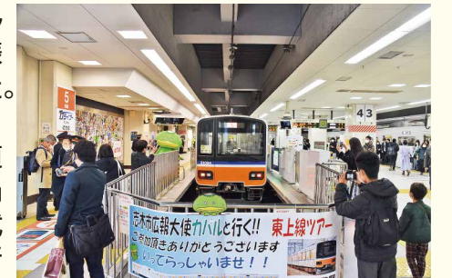
池袋駅を出発するカパルトレインツアー。新庁舎では議場のマルチビジョンに、許可を得た上で映写資料としてこのような画像・資料の紹介ができるようになりました

私は、人と人をつなぐこと、行政の知恵と民間のアイデアと活力を合成して、志木の元気につなげることも議員の役割の一つと考えておりますので、引き続きコツコツと励んで参りますので、ご指導ご協力をよろしくお願い致します。