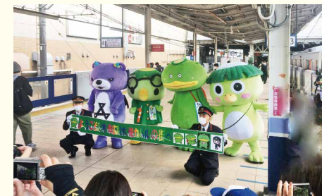
志木駅ホームでカパル・カッピー・お友達キャラと撮影